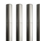
Osłonka na zawiasy

Zestaw wyposażenia INOX w cenie wszystkich drzwi prezentowanych na ulotce