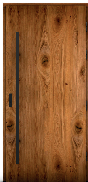
Jagienka Ryc 04