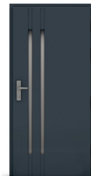
Dekasuw Alu 02