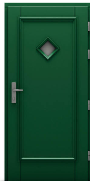
Garbaś Vin 10