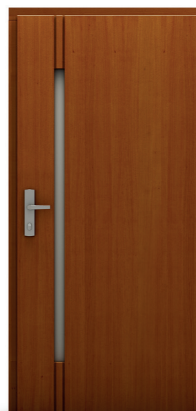
Dragon Ryc 01