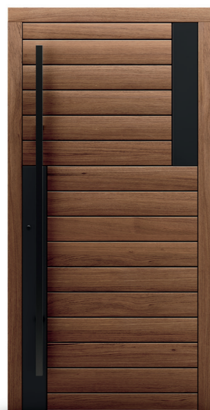
Acero Arb 05