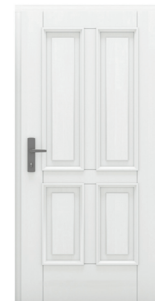
Lhotse Vin 05