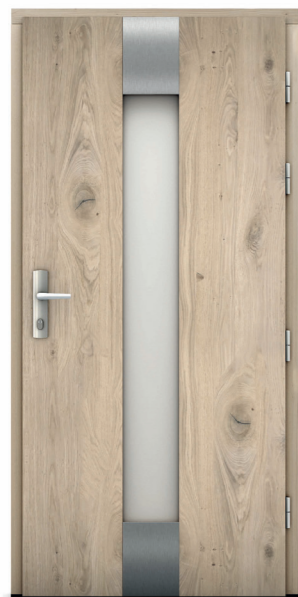
Zawisza Ryc 11