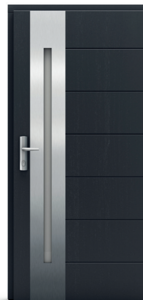
Longinus Ryc 06